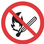
Förbud mot att införa eld